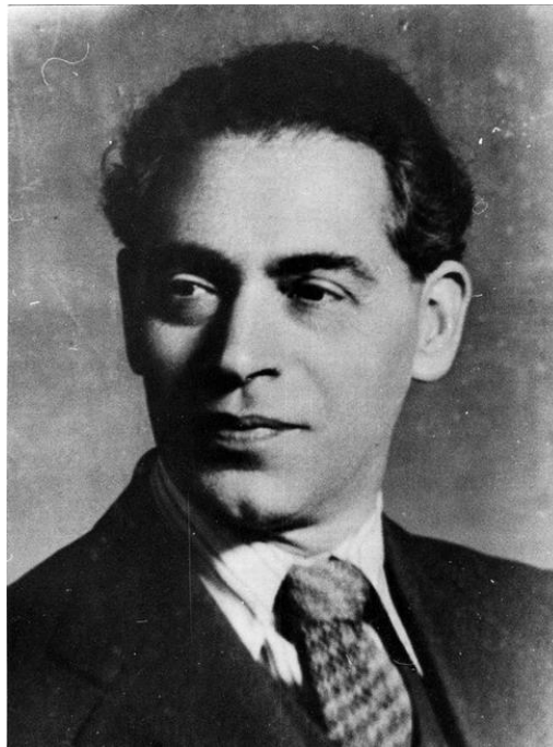
Рисунок 3 – Борис Михайлович Иофан, архитектор Дворца Советов

В ходе большого открытого конкурса были предложены многие перспективные идеи и решения, но окончательный проект Дворца Советов так и не был принят. Победители всесоюзного состязания были приглашены продолжить участие в разработке идеи главного проекта во втором закрытом конкурсе, проходившем с августа 1932 г. по февраль 1933 г.