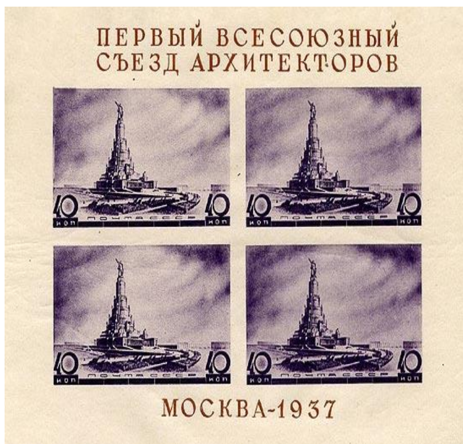
Рисунок 4 – Проект Дворца Советов на издании Первого всесоюзного съезда архитекторов, 1937

Победа проекта Бориса Иофана и сам конкурс подвели важную черту – в архитектурном стиле СССР уходил от поисков конструктивизма и авангарда 1920-х годов, нужен был язык архитектуры, где доминировала не только функция здания. Этим языком стал Ар Деко. Зачастую можно встретить рассказ о том, что Дворец Советов – воплощение так называемого сталинского ампира, но это ошибка. По стилю это, безусловно, Ар Деко в советской версии, международный стиль, просто пришедший в СССР с опозданием на десять лет.