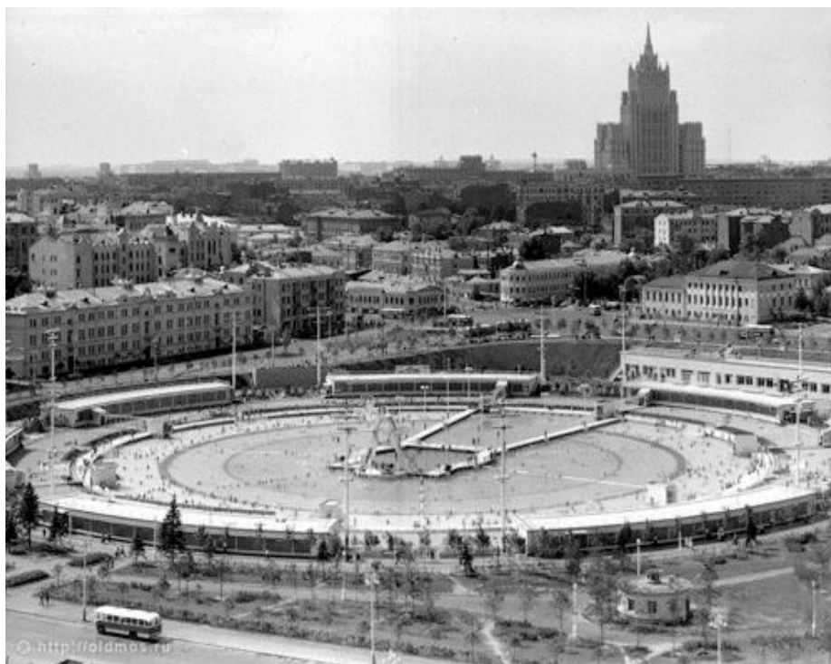
Рисунок 2 – Бассейн «Москва»

Идею строительства в столице Дворца Советов впервые озвучил в 1922 г. Сергей Киров на Первом Всесоюзном съезде Советов, проходившем в здании Большого театра.