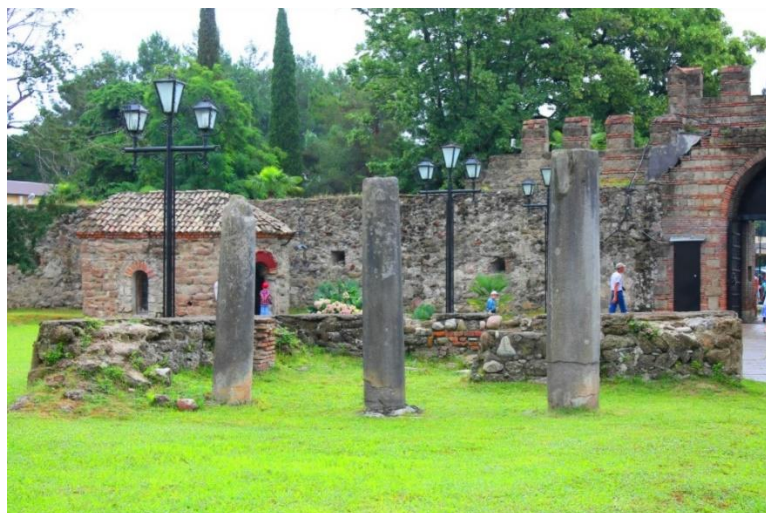
Рисунок 3 – Руины Пицундской базилики IV в.

Архитектурный стиль Абхазии характеризуется использованием местных строительных материалов, таких как камень и дерево, что отражает природное богатство региона и его климатические особенности. Каменные постройки демонстрируют мастерство абхазских зодчих в обработке и укладке камня, что видно на примере руин Пицундской базилики IV в. (рисунок 3). Деревянные элементы, использовавшиеся в строительстве жилищ и общественных зданий, подчеркивают экологичность и гармонию с природой.