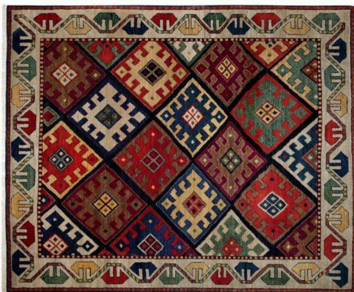
Рисунок 4 – Национальный орнамент абхазских ковров

Декоративно-прикладное искусство. Декоративно-прикладное искусство Абхазии включает в себя разнообразные ремесла: ковроделие, вышивку, резьбу по дереву и камню. Эти ремесла сохраняют и передают из поколения в поколение уникальные традиции и техники, что является важной частью культурного наследия региона. Например, ковры, изготовленные по традиционным методам, отличаются сложными орнаментами и высококачественными натуральными материалами, такими как шерсть и шелк (рисунок 4). Эти ковры не только украшают интерьеры, но и символизируют культурное богатство Абхазии [9, с. 728].