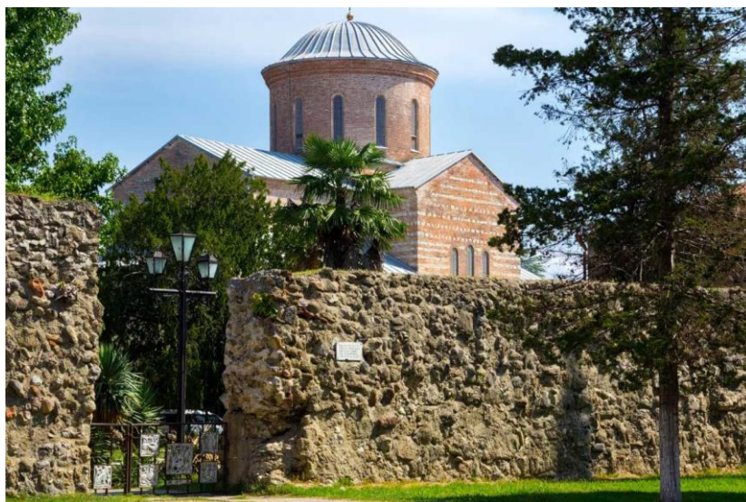
Рисунок 1 – Сохранившиеся постройки города Себастополис

Многие из этих артефактов были обнаружены в культурных и торговых центрах, таких как античные города Себастополис (нынешний Сухум) и Питиунт (Пицунда) (рисунок 1), что свидетельствует о важности и значении искусства в жизни древних абхазов [5, с. 86-89].