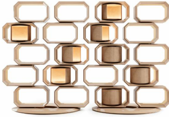
Рисунок 10 – Модульная система GEOWALL компании Anikin Interiors

Сложение функций может представлять собой как заранее заложенное в проект, так и ситуационное решение пользователей жилья или дизайнеров об использовании одного жилого пространства или предмета интерьера для различных сценариев жизнедеятельности. Так, обеденный стол в остальное время превращается в рабочий, а просторная детская – в зал для йоги. Получило большое распространение и становится, практически, стандартом совмещение кухни и гостиной. Организация кабинета в спальне, идея совмещенного санузла также являются примерами сложения функций.