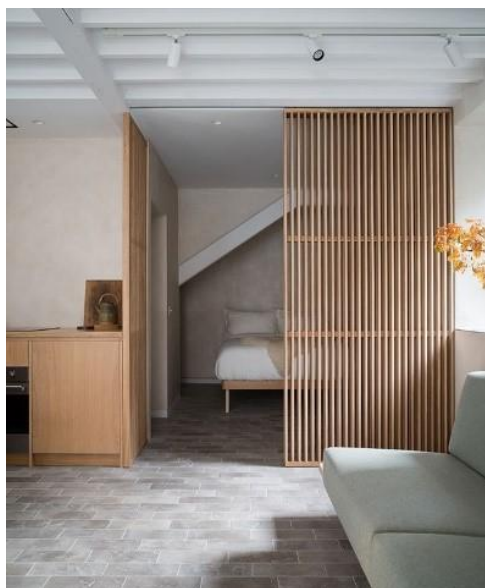
Рисунок 7 – Фрагмент интерьера: деревянные реечные перегородки

К приемам трансформации пространства также следует отнести и приемы условного зонирования, такие как стеллажи, ширмы, деревянные реечные перегородки (рисунок 7). Такие решения хотя формально и не меняют, и не создают новые помещения, но позволяют сделать универсальное пространство более разнообразным, зоны функционально определенными, в ряде случаев, выполняя и вполне практические функции: ограничения зоны визуального контакта, формирования маршрутов движения.