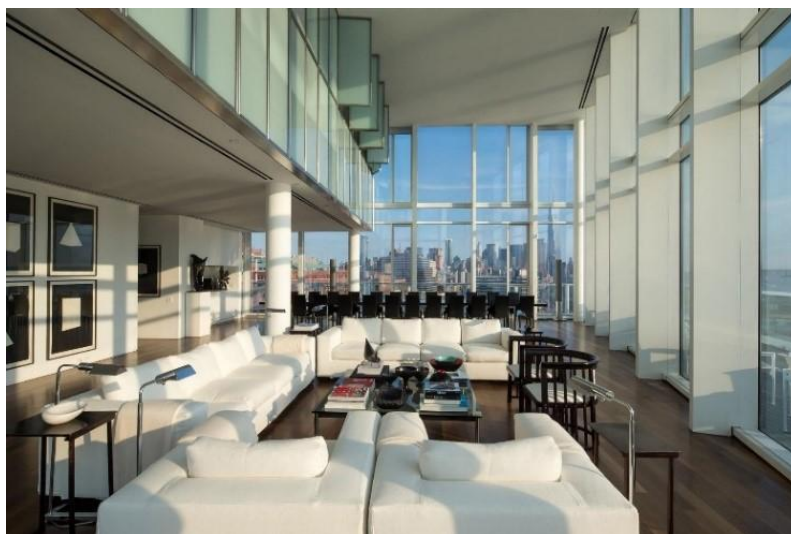
Рисунок 3 – Лофт в Нью-Йорке в стиле минимализм

Начиная с 1960–х годов в Америке (во многом благодаря архитекторам и художникам, эмигрировавшим через океан в период разгула фашизма в Европе), а в последующем, постепенно, и во всем мире, минимализм начинает набирать обороты, пройдя эволюцию от стиля революционеров и нонконформистов от искусства до мейнстримного стиля наиболее продвинутой буржуазии, «благородной» элиты. В эти же годы появляется и сам термин «минимализм», как производное от английского «minimal art». Начиная с 1960–х годов этот стиль проникает во все сферы культуры и быта, моду, архитектуру, промышленный дизайн.