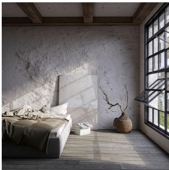
Рисунок 1 – Японский интерьер в стиле Ваби-саби

организацию жизненного пространства... Чтобы яснее понять, что такое японский интерьер, нужно иметь представление о некоторых особенностях японской культуры и мироощущения восточных жителей. Их отличает терпение и высокая духовность, философский подход к жизни и даже некоторое стремление к аскетизму. Поэтому японскому жилищу свойственны монохромность, четкость композиций, предельная простота оформления» [1].