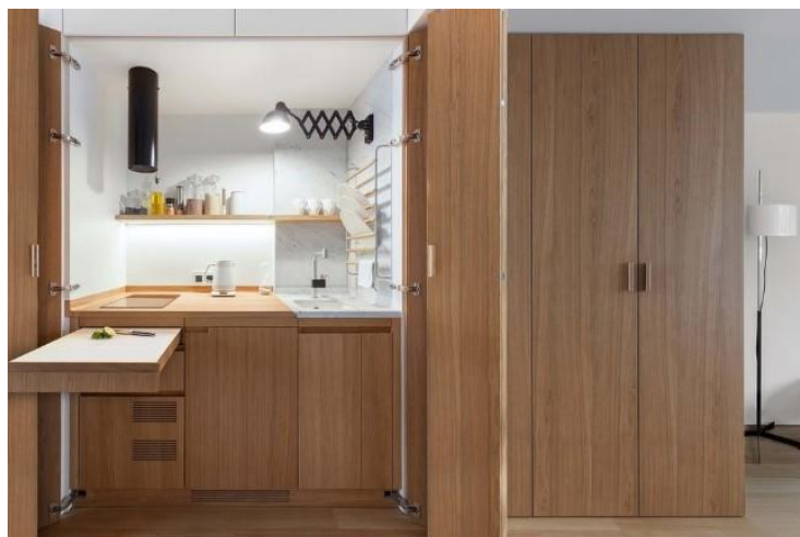
Рисунок 5 – Фрагмент интерьера: встраиваемая кухня

К одному из приемов трансформации пространства относится организация скрытых пространств и встраиваемых в них элементов. Это и уже прочно вошедшие в современный интерьер гардеробные ниши, ниши для хранения бытового оборудования, спортивного инвентаря. Сюда же следует отнести и ниши с выкатными или раскладывающимися кроватями, а также кухонные ниши, скрывающие в себе кухонное оборудование, которое в нерабочем состоянии полностью встраивается и скрывается в пространстве стены (рисунок 5).