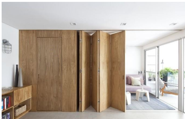
Рисунок 6 – Фрагмент интерьера: сдвижная перегородка

К приемам трансформации пространства также следует отнести и приемы условного зонирования, такие как стеллажи, ширмы, деревянные реечные перегородки (рисунок 7). Такие решения хотя формально и не меняют, и не создают новые помещения, но позволяют сделать универсальное пространство более разнообразным, зоны функционально определенными, в ряде случаев, выполняя и вполне практические функции: ограничения зоны визуального контакта, формирования маршрутов движения.