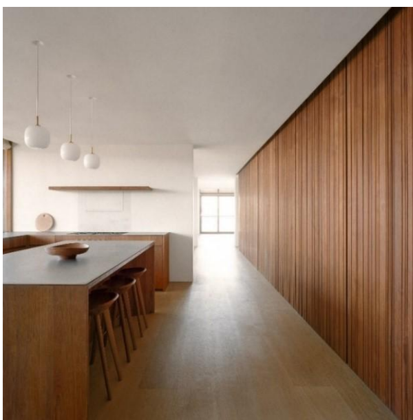
Рисунок 4 – Апартаменты в Копенгагене. Дизайнер Джон Поусон