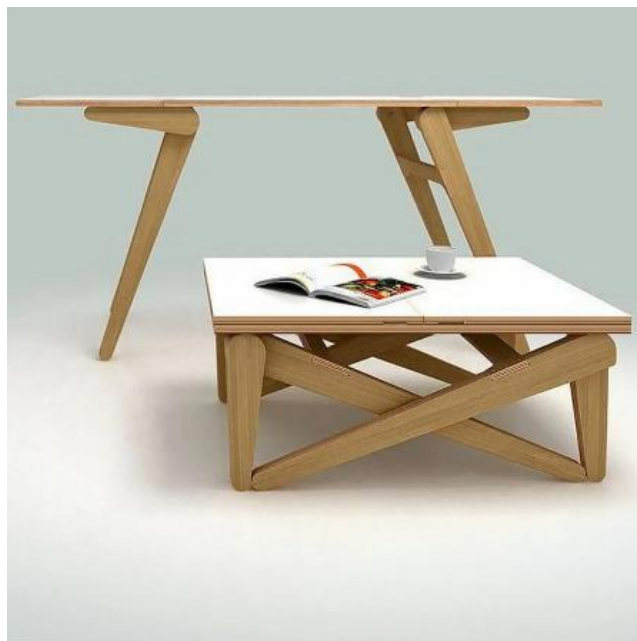
Рисунок 9 – Система Kitchen Box компании CLEI Living&Young

например, компания CLEI Living & Young с их системой Kitchen Box (рисунок 9).