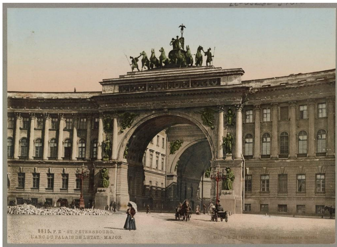
Рисунок 3 – Здание Главного штаба в Санкт-Петербурге

империи как многонационального образования с богатой историей. Монументальная архитектура (например, здание Главного штаба в Санкт-Петербурге, см. рисунок 3) комбинировала элементы классицизма с мотивами русского зодчества.